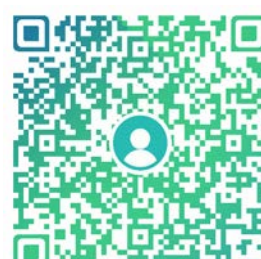
百度贴吧：上海国家会计学院研究生部吧