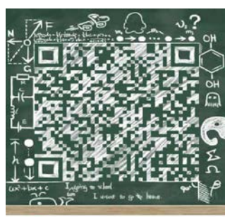
上国会非全日制考研群 扫一扫二维码，加入该群。