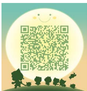
上国会考研交流群 扫一扫二维码，加入该群。