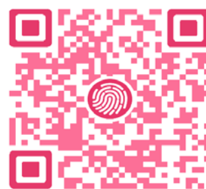
考研论坛上海国家会计学院专版