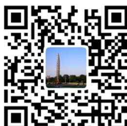
微博：上海国家会计学院研究生部