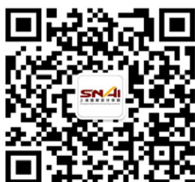
微信：上海国家会计学院

为方便您备考咨询，您可关注官网： master.snai.edu ，电话：021-69768051，及邮箱： mpacc@snai.edu ，或通过以下渠道获取在读生备考经验。此外，登录映客 APP，搜索映客号：118331046（SNAI 研招办），也可回看校园开放日等活动直播视频，或是参与下次直播互动，直接了解一手信息。